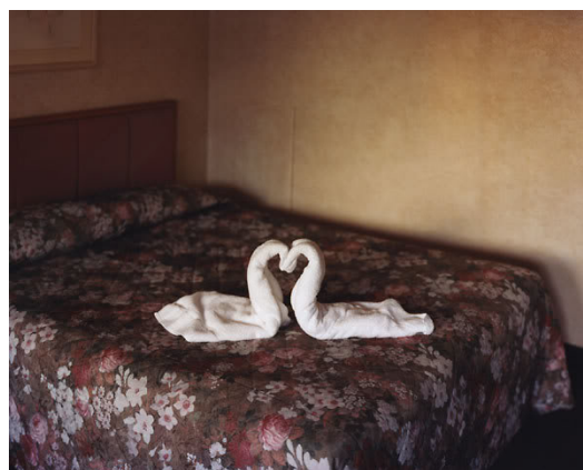
Two Towels, Niagara , 2004. Alec Soth