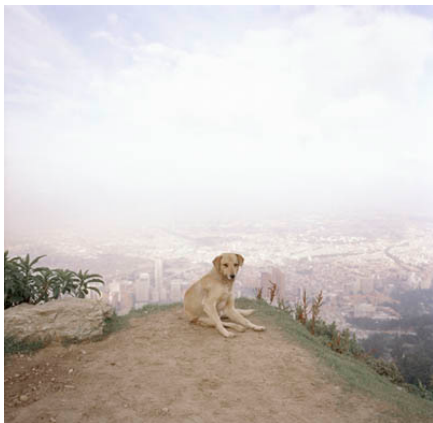
Untitled. Dog Days, Bogotá . Alec Soth

Na verloop van tijd kreeg Sleeping by the Mississippi een gestaag groeiend publiek en Soth voelde druk om verder te gaan. Hij besloot zich te richten op de Niagara waterval. De waterval is een plek waar liefde en dood samenkomen. Verliefde stelletjes trouwen in een van de vele kapellen. Tegelijkertijd is Niagara ook een plek waar minder gelukkige mensen met een einde aan hun leven maken door in de enorme watermassa te springen. Volgens Soth is Niagara juist door deze tweestrijd ‘a really saucy place’. Met Niagara probeert hij deze tegenstrijdige emoties van de locatie vast te leggen. ‘I’m very much an American photographer’ verklaart Soth. Hij houdt van het landschap van noordelijk Amerika omdat hij weet hoe het landschap te lezen. Hij vindt het interessant om over dit landschap te communiceren zodat de kijker het landschap ook kan gaan begrijpen. Voor Niagara liet Soth, net als aan de Mississippi, mensen die hij ontmoette iets opschrijven, ditmaal in de vorm van liefdesbrieven. Ze lopen uiteen van onschuldige liefdesverklaringen tot grove scheldpartijen, naarmate het boek vordert. Ook dit keer vormden de brieven de aanknopingspunten van waaruit Soth van beeld naar beeld werkte.