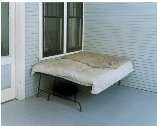
Charles Lindberghs boyhood bed Little Falls, Minnesota, 1999. Sleeping by the Mississippi , Alec Soth