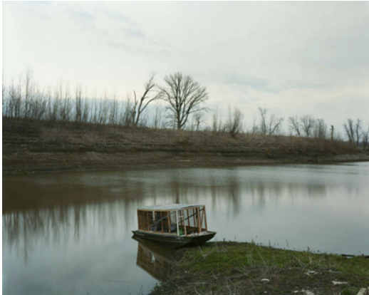
Saint Genevieve, Missouri, 2002. Sleeping by the Mississippi , Alec Soth

dit met een afbeelding waar verschillende punten verspreid in een ruimte kris kras met elkaar verbonden zijn.